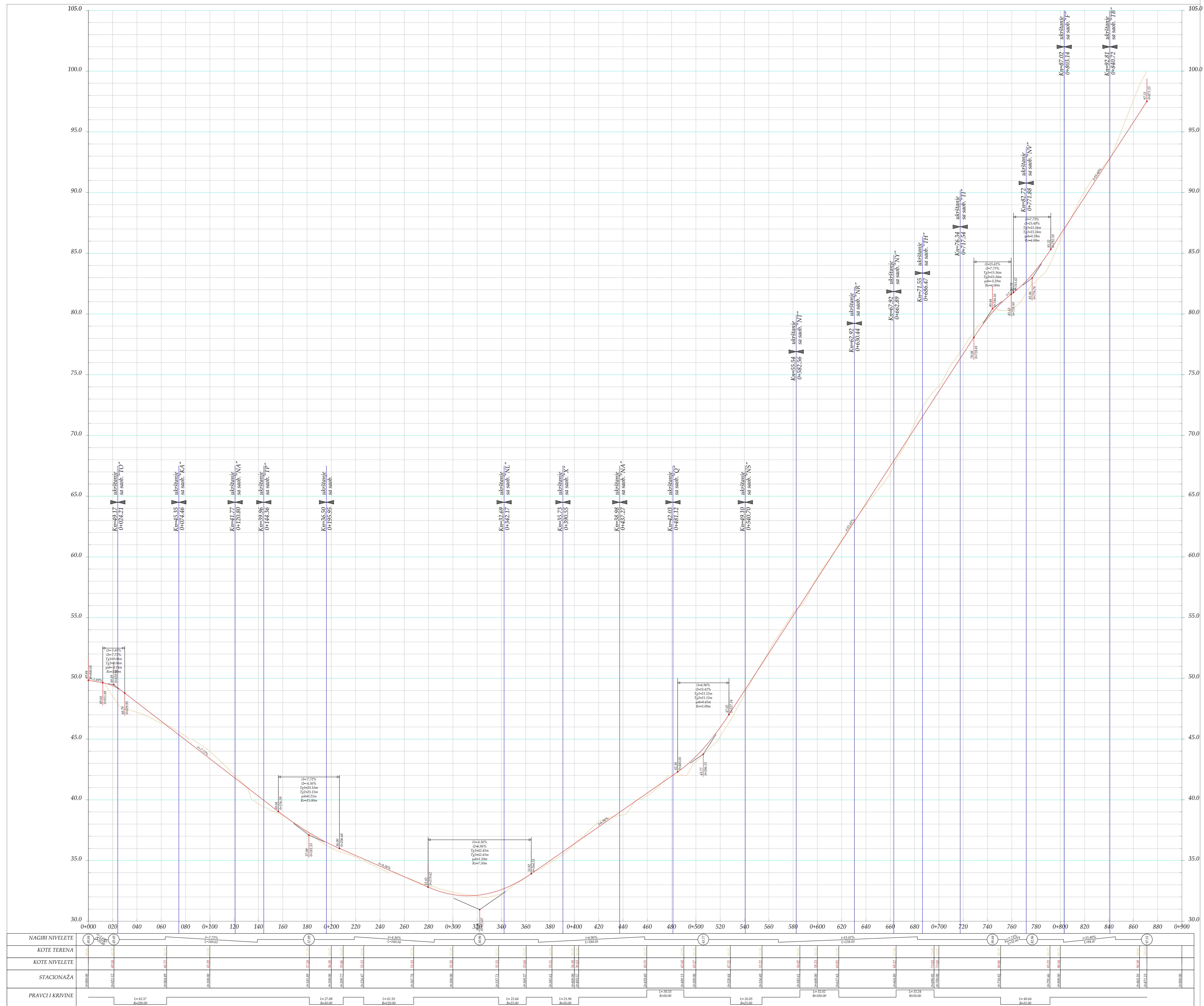
5. UZDUŽNI PROFIL SAOBRAĆAJNICE "Z" R 1:100/1000