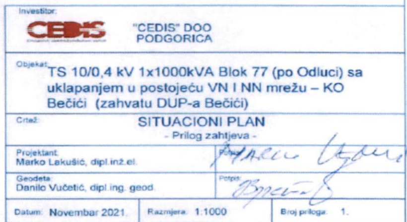
Grafički prilog planirane lokacije – prilog “Situacioni plan” po tehničkim uslovima CEDIS-a