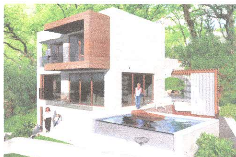
Primjer moderno oblikovanog objekta sa elementima tradicionalnog