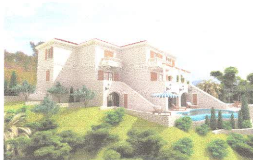
Primjer objekta u tradicionalnom stilu

Ukoliko se povećava spratnost na 4 etaže obavezno je projektovati ravan krov.