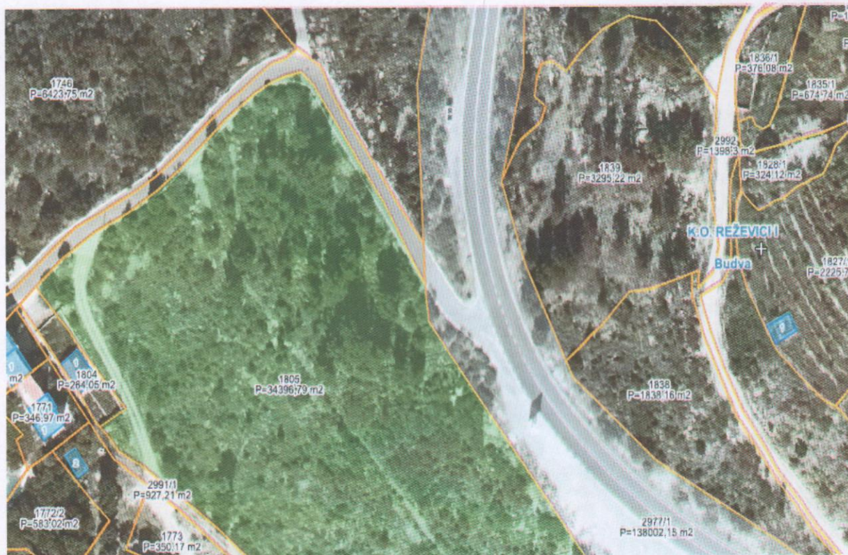
Grafički prilog planirane lokacije – izvod sa Geoportala Uprave za nekretnine Crne Gore

Elementi urbanističko-tehničkih uslova za izradu glavnih projekata i njihovu reviziju za navedeni objekat definisani su u prethodnim tačkama i u grafičkom prilogu.