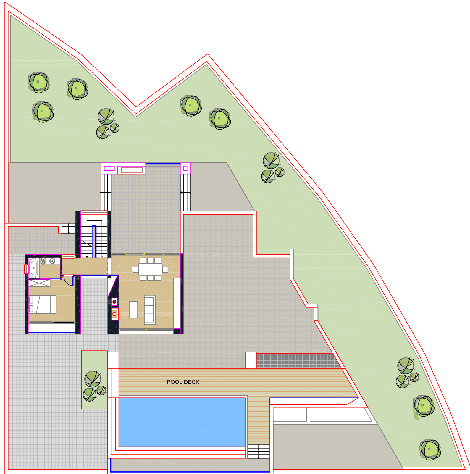
OSNOVA 1 SPRATA