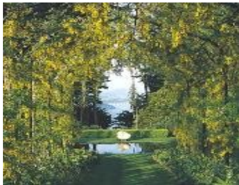
primjer zasjene pješačkih staza

pružanja staza predvidjeti drvorede ili masive zelenila, radi stvaranja sjenke, a moguće su i nastrenice-pergole sa puzavicama. Na platoima predvidjeti klupe na betonskim podzidama za predah. Neophodno je predvidjeti rasvjetu.